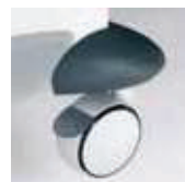
Roulette avec frein